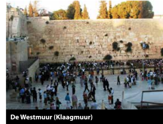
De Westmuur (Klaagmuur)

Het vijftigjarige jubileum van het Israelische gezag over de Oude stad, Oost-Jeruzalem en de andere in 1967 veroverde gebieden maakt internationaal veel kritiek los. De laatste maanden van 2016 zagen een waar offensief van internationale uitspraken