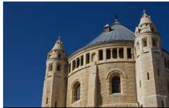
Kerk van de Dormition, op de Zionberg

jaar met Pesach dat ze “volgend jaar in Jeruzalem” willen zijn en bij elke bruiloft wordt aan de verwoesting van de tempel (en verdrijving uit Jeruzalem) herinnerd met het breken van een glas.