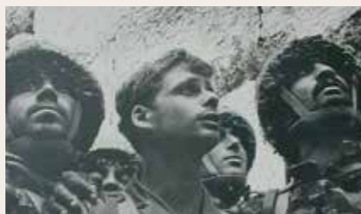
De soldaten die in 1967 als eerste de Westelijke Muur bereikten.

Israel draagt het beheer over de Tempelberg formeel weer over aan de islamitische beheersautoriteit (Waqf). Later kwam (nog steeds geldende) regelgeving waaronder Joden de Tempelberg wel mogen bezoeken, maar daar niet mogen bidden. Doel is het Arabisch-Israelisch conflict ‘territoriaal’ te houden en het potentieel voor een Joods-islamitisch religieus conflict weg te nemen.