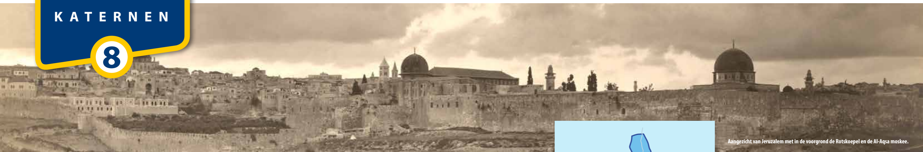
Aangezicht van Jeruzalem met in de voorgrond de Rotskoepel en de Al-Aqsa moskee.

Volgens de Bijbelse voorspellingen is Jeruzalem in onze dagen 'een beker van bedwelming voor de volken rondom' geworden en 'een steen die moeilijk te tillen is voor alle volken'. 1