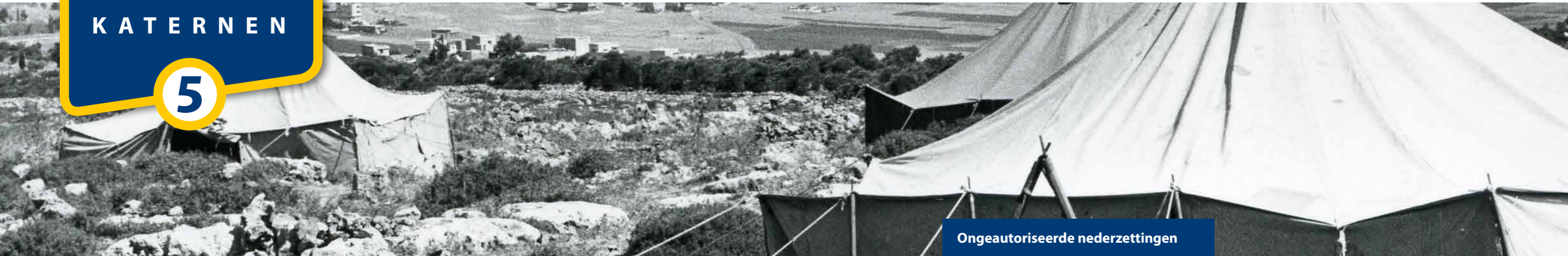
De voormalige nederzetting Elon Moreh