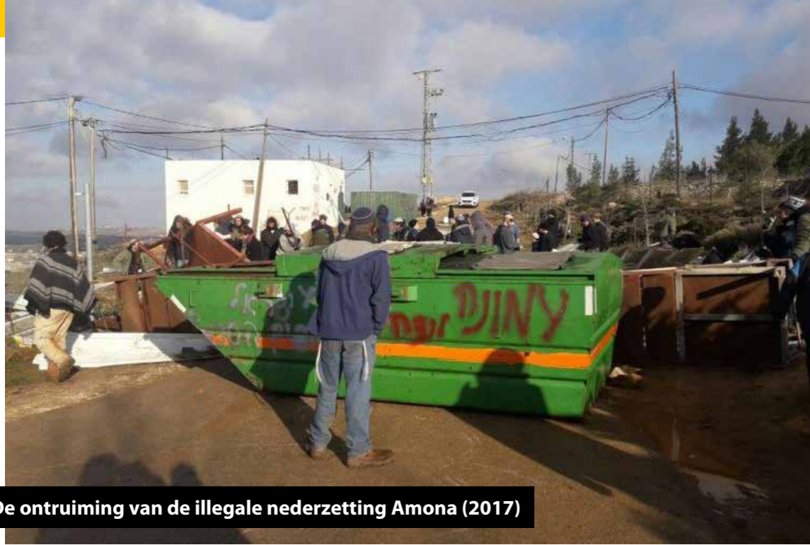
De ontruiming van de illegale nederzetting Amona (2017)

om lidmaatschap van de VN. Premier Netanyahu sprak zich in 2009 uit tegen het bouwen van nieuwe nederzettingen, maar vond wel dat de bestaande nederzettingen versterkt mogen worden. Inmiddels steunt hij de bouw van een nieuwe nederzetting voor de inwoners van Amona, een illegale 'outpost' die eerder werd ontruimd na een uitspraak van het Israëlische Hooggerechtshof. Netanyahu accepteert geen bouwstop in Oost-Jeruzalem, dat hij ziet als deel van de hoofdstad van Israël.